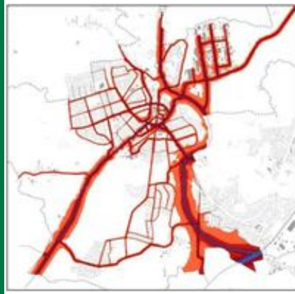
Strategische Lärmkarte Gesamtstraßennetz

- verglichen mit ähnlichen Umfragen in anderen Städten - ein stattliches Ergebnis. Im Herbst wird die Stadt zudem einen für Bürgerinnen und Bürger offenen Workshop anbieten. Die Anregungen werden in die Fortschreibung der Lärmaktionsplanung aufgenommen und auf Umsetzbarkeit und Finanzierung geprüft, was zu Juli 2024 abgeschlossen sein wird.